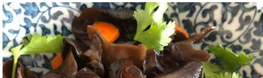
Image trompeuse, on va parler mycologie et pas cuisine