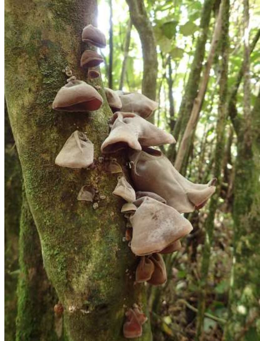
Auricularia cornea (Nouvelle-Zélande)

L'auriculaire française convient très bien pour la préparation de plats asiatiques